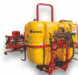
opryskiwacze zawieszane 300-1500l