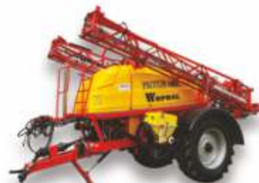
opryskiwacze polowe 1200-5000l