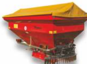
rozsiwacze Junior II 600-1200kg