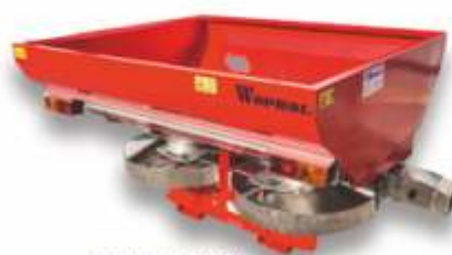
rozsiwacze Junior II 600-800kg