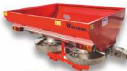
rozsiwacze Junior II 600-800kg