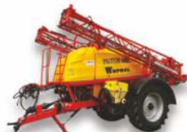
opryskiwacze polowe 1200-5000l